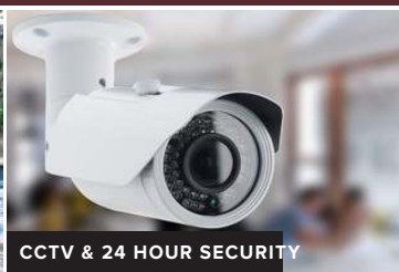
CCTV & 24 HOUR SECURITY